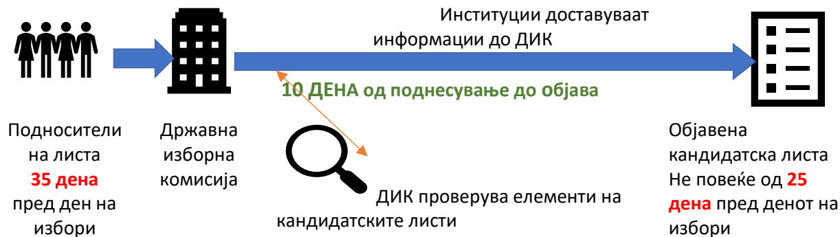
Илустрација 1: Постапка за поднесување на кандидатски листи при редовни парламентарни избори

Како што забележува Венецијанската комисија при Советот на Европа 4 , Изборниот законик не се изјаснува по прашањето на повлекување на кандидати и/или кандидатски листи откако ќе бидат потврдени од страна на изборните органи. Би било полезно ова прашање да се доуреди, со цел да се обезбеди јасна правна состојба. Ова е уште порелевантно во сегашните околности кога изборниот процес е во мирување и ќе продолжи после повеќе недели/месеци.